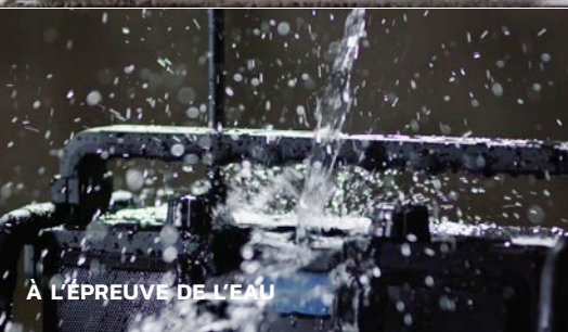
À L'ÉPREUVE DE L'EAU