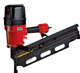
F 42/130 P2