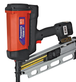
TRAK IT 20°