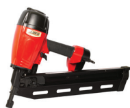
F 38/100 P2