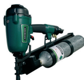
PKT RK 90