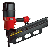
F 50/160 P1