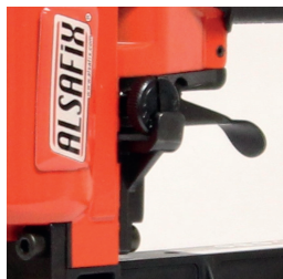
Réglage de cadence de tir